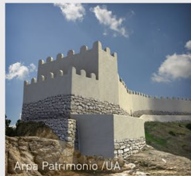
Arpa Patrimoni / UA

Constituïen una societat jerarquitzada, governada per una elit que organitzava l'explotació del camp i controlava les relacions comercials des de ciutats fortificades. La vida quotidiana es desenvolupava en cases on no sols es cuinava, menjava i dormia, sinó que també s'hi duïen a terme activitats artesanals i metal·lúrgiques, i fins i tot cultes als avantpassats i les divinitats.