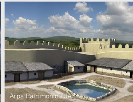
Arpa Patrimoni / UA